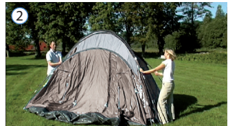
② TELTET BØR REJSES AF MINDST 2 PERSONER THIS TENT SHOULD BE ERECTED BY AT LEAST 2 PERSONS DIESES ZELT SOLLTE WENN MÖGLICH VON 2 PERSONEN AUFGESTELLT WERDEN