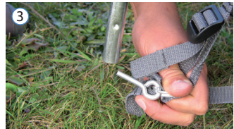
③ "RING & PIN" SYSTEM FOR NEM OPSÆTNING "RING & PIN" SYSTEM FOR EASY SET UP "RING & PIN" SYSTEM FÜR LEICHTEN AUFBAU