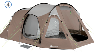
④ ENDELIG FASTGØRELSE AF BARDUNLINIER FINALLY SECURE THE TENT AGAINST STRONG WIND SPANNEN SIE ZUM SCHLUSS DAS ZELT